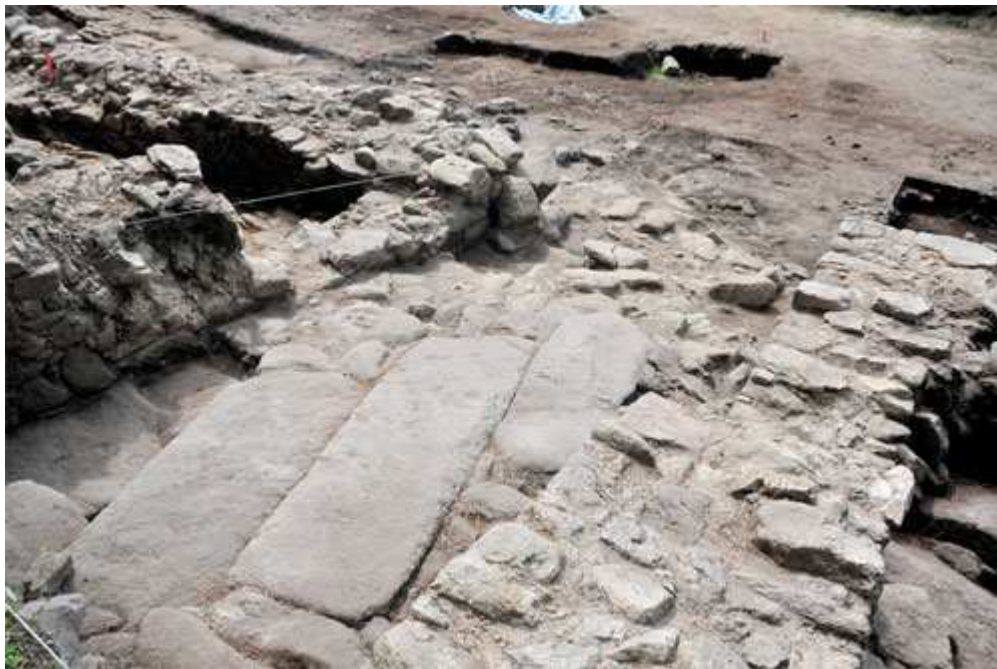
Laxes cubrindo o chan da entrada monumental