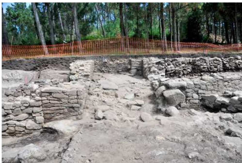
Entrada monumental ao castro de Castrelo.

Atención: se te interesa o patrimonio e a arqueoloxía en Galicia isto é importante. As obras de ampliación da estrada AC-433 a Laxe acaban de revelar un achado fascinante. Creo que esta é a primeira vez que se ve en público.