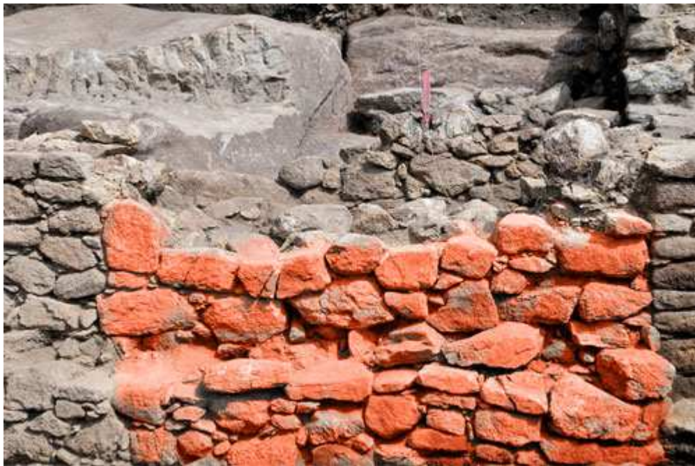
Porta tapiada (coloreada dixitalmente)