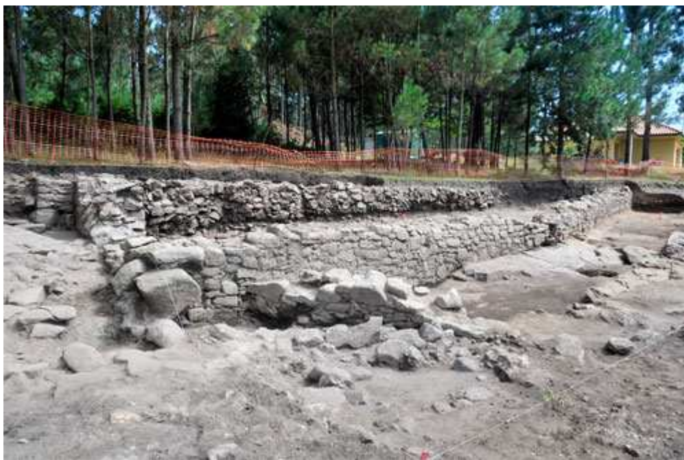
O ancho da muralla pode superar os 3 ou 4 metros

Na zona interior poden verse, se cadra, os inicios dun corpo de garda. Trátase dun achado moi importante, nada habitual nas escavacións do mundo castrexo en Galicia. A muralla ten un escalonado característico, que está a aparecer nas últimas escavacións da Idade do Ferro en Galicia, pero creo que deste tipo de murallas aínda se sabe pouco. Tras del, un castro cunha interesante configuración de plataformas e parapetos está acochado baixo un pinar. Pero este espazo monumental, ubicado no medio dunha aldea actual parece indicar que o xacemento de Castrelo é especialmente valioso. E, sen dúbida, é un dos achados máis relevantes desta campaña arqueolóxica de verán en Galicia. Non puiden falar cos arqueólogos, xa que fun en fin de semana, pero sería interesante coñecer que atoparon nestas ruínas.