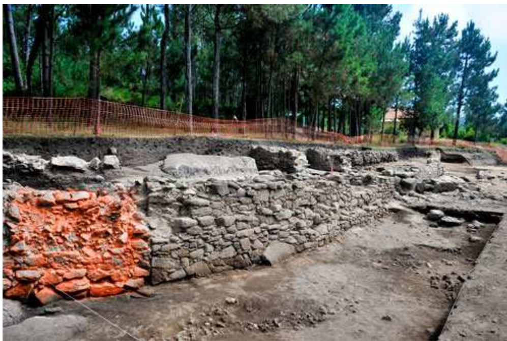
Posible porta tapiada ou derrube (coloreada dixitalmente)

Pero hai máis: o achado complétase cun intrigante detalle curioso que, cando menos, se produce nunha ocasión nesta escavación. Ao carón da entrada monumental, á súa esquerda, advírtese unha segunda porta, pero tapiada. Na foto está coloreada dixitalmente para que a poidas apreciar. E uns metros máis ao norte, como ves nestoutra foto, tamén podería haber outra porta tapiada. ¿Por que? Un misterio. Trátase de algo rarísimo, excepcional, no mundo dos castros.